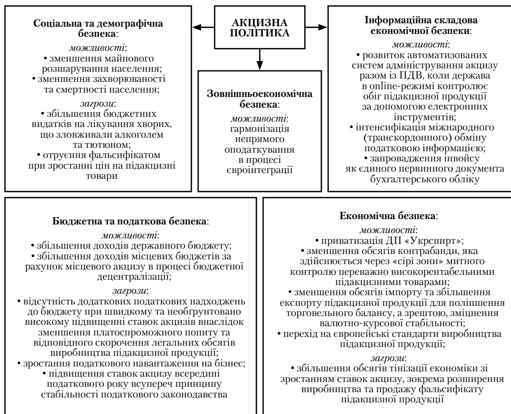
Рис. 1. Схема впливу акцизної політики на економічну безпеку держави [складено автором]

У 2015 р. ця тенденція закріпилася: після ПДВ (178,5 млрд грн, або 27,4 % доходів) та ПДФО (100,0 млрд грн, або 15,3 %), акцизний податок (70,8 млрд грн, або 10,9 %) знову посів третью позицію за значущістю серед доходів (652,0 млрд грн) зведеного бюджету. А податку на прибуток (39,1 млрд грн, або 6,0 % доходів) навіть в умовах значних переplat, здійснення авансових внесків та відміни ряду пільг стало надходити менше, ніж рентної плати за спеціальне використання природних ресурсів (42,0 млрд грн), ввізного мита з додатковим імпортом збором (39,9 млрд грн), коштів НБУ (61,8 млрд грн) чи власних надходжень бюджетних установ (41,6 млрд грн).