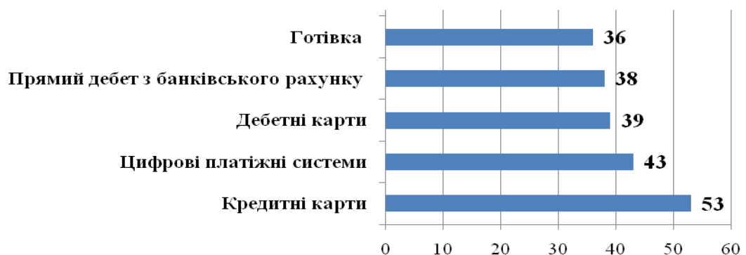
Рис. 2. Частка фінансових трансакцій з використанням різноманітних засобів грошового обігу при купівлі товарів та послуг учасниками глобального ринку у 2016 р., % 3

- основні глобальні тренди до цифровизації в усіх сферах життя: перехід суспільства на новий технологічний уклад та масштабне проникнення цифрових технологій у всі сфери; трансформація банків у цифрові платіжні системи (поступове запровадження 100% електронних грошей) (рис. 2);